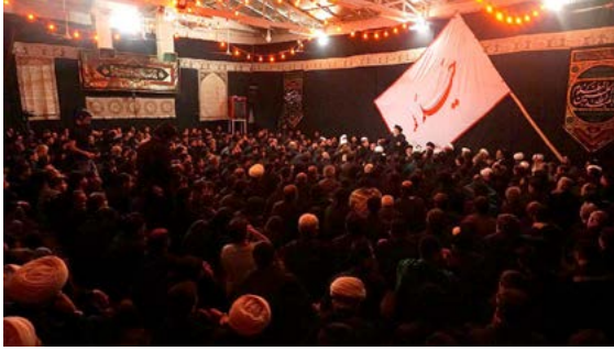
Aşura Merasiminde Sadık eş-Şirazi Müntesipleri Arasında, Kum, 2016

etti. Silahlı eylemlerin Şii azınlıklar için olumsuz sonuçlar doğurması ve şiddet kullanmanın siyasi amaçlara ulaşmada başarı sağlamaması da Şirazilerin siyasi diyaloga gitmesinde etkili olmuştur (Khalaji, 2012). Seksenli yılların ortasında başlayan bu diyalog çabaları, Suudi Arabistan'ın Suriye Büyükelçisi Ahmet el-Hekimi ile Arabistan Şirazilerinin görüşmesiyle başladı (el-İbrahim ve es-Sadık, 2013:176). Arabistan'daki Şiiilerin siyasallaşmasında büyük etkisi olan Şirazi kanaat önderlerinden Muhammed Taki el-Seyf'in oğlu Tefvik el-Seyf'in doğrudanlığına göre Suudi İstihbarat Müsteşarı Türki el-Faysal'ın temsilcisiyle görüşen Şirazi muhalefeti temsilcileri, 1990 Eylül'ünde Arabistan'ın Washington Büyükelçiliğinde Bender b. bin-Sultan'la müzakere masasına oturdu (el-İbrahim ve es-Sadık, 2013:177).