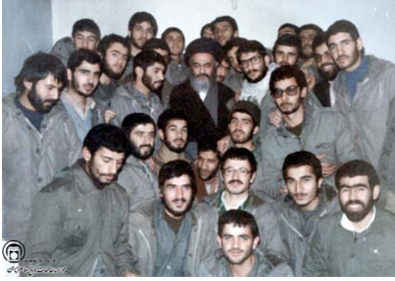
Muhammed eş-Şirazi'nin Devrim Muhafızlarıyla Görüşmesi, Kum 1980

olarak Hafız Esed, Nusayri kimliğini geri plana iterek Şiiilerle yakın ilişkiler kurma yoluyla İslami kimliğini vurgulamayı amaçlamıştır. Bu doğrultuda Esed, Caferi fikhını yayan Nusayri-leri ve ünlü Şii din adamlarını desteklemiştir. 10