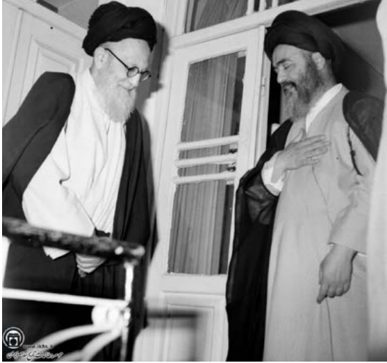
Muhammed eş-Şirazi’ nin Ayetullah el-Uzmâ Şeriatmedariyle Görüşmesi, Kum 1979

dan daha öncelikli bulduklarından 1980’lerde pragmatist bir dış politikanın gerekli olduğunu düşünüyorlardı. Bu noktada pragmatist kanat, devrim ihracına karşı değildi sadece söz konusu projenin silahlı eylemlerden daha ziyade propaganda aracılığıyla gerçekleştirilmesi gerektiği kanaatindeydi (Louër, 2012: 53). Ancak güvenlik güçleri ve Devrim Muhafızları başta olmak üzere devlet kurumlarına yerleşen ideolojik ve radikal güçler, devrim ihracı konusunda taviz vermiyordu. Pragmatist kanadın tasfiye edeceği ilk kesim, söz konusu ideolojik güçlerin en örgütlü ve etkin olan Ayetullah Munteziri ile Ayetullah Muhammed eş-Şirazi’ye bağlı hareketler olacaktı (Khalaji, 2012). Aynı zamanda 1982 yılından itibaren İran rejimi, bölgede kendi güdümünde yeni ilişkiler geliştirmeye başladı (Louër, 2009).