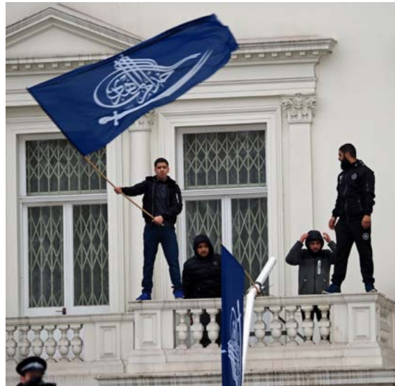
Şirazilerin, 9 Mart 2018’de Londra’daki İran Büyükelçiliğine Baskını

olmasa bile az da değildir” şeklindeki övülen Hüseyin eş-Şirazi, 30 Kasım 2017’de yaptığı bir konuşmada, velayet-i fakihi sert bir dille eleştirdi (BBC, 2018). Rejimin hiçbir alanda eleştiriye açık olmadığını belirten eş-Şirazi, rejimin “kutsal olmayanları kutsadığını” ifade etti. eş-Şirazi yıkıcı savaşların kutsal olmadığını ifade ederek dolaylı bir şekilde İran-İrak savaşının İran tarafından “mukaddes müdafaa” olarak anılmasını, kutsal olmayana kutsama için bir örnek olarak gösterdi. Velayet-i fakihe muhalif Ayetullahları yıldırma politikalarına da değinen eş-Şirazi, Şii fıkıh tarihinin en önemli isimlerinden Şeyh Ensari’nin de velayet-i fakih teorisini kabul etmediğini vurguladı. Şirazilere karşı “İngiliz Şiisi” ithamlarını yersiz bulan eş-Şirazi, Firavun’un da Musa ile Harun’u din düşmanı ilan ettiğini, kendini insanların rabbi olarak gördüğünü belirtmiştir. Ona göre bugün de velayet-i fakihin [hissettirdiği] ile Firavun’un “Ben sizin rabbinizim” dediği aynı şeydir. İnsanların veliyy-i fakih olmadan doğru karar veremeyecekleri görüşü kölelik sisteminin yeniden kurulmasıdır. Firavun’un [İslam Cumhuriyeti’nin] sistemi bunu kutsal gösterse de velayet-i fakih rejiminde halk köle ve kul mesabesine inmektedir. Ayetullah Humeyni’nin “Velayet-i fakih, Allah’ın peygamberinin ve Allah’ın kendi velayetidir” ifadesindeki velayeti, bir fakihe yüklemek, Hüseyin eş-Şirazi’ye göre Firavunluk anlamına gelmektedir (Kediver, 2018).