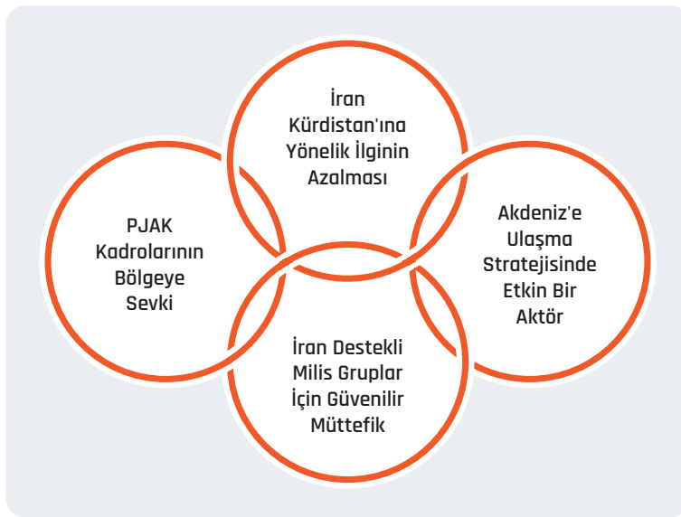
Şekil 3: İran Açısından Suriye-İran-PKK Eksenli PYD/YPG'nin İşlev ve Nitelikleri