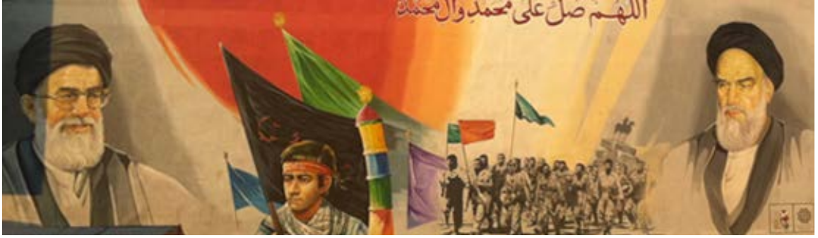
(Tahran'da bir billboard)

Hastaneler, okullar, kurslar, yardım kuruluşları, dernekler, vakıflar, kültür merkezleri vb. pek çok kurumsal yapı da yumuşak güç unsurlarının propagandasını geliştirerek siyasi yapılanmalara nüfuz sağlamak üzere gizli amaçlar için çalışabilmektedir. İran'ın hemen hemen tüm bölge ülkelerinde, hatta dünyada İslam nüfusunun var olduğu hemen her ülkede, bu anlamda örgütlenmeleri vardır. Bu kuruluşların öncelikli amacı İran'ın uluslararası itibarını düzeltmektir. Nitekim 1979 Devrimi'nin hemen ardından Ayetullah Humeyni bu yönde çalışmaların geliştirilmesi talimatını bizzat vermiştir. 13 Aralık 1979'da Humeyni, İran Dışişleri Bakanı Sadıq Kutupzade'den, ABD'nin İran'a yönelik agresif politikalarının ve ABD güdümünde, İran'a yönelik kınama kampanyaları yürüten organizasyonların değerlendirilmesini istemiştir. Aynı şekilde ABD'nin bu propagandalarına karşı çıkan bağımsız uluslararası kuruluşlarla da irtibat kurmasını istemiştir. 16 21. yüzyılda İran'ın bu anlamda çalışmaları değerlendirildiğinde, sadece ABD propagandasını değil, İran'ın kendi pozitif propagandasını da yaygın bir şekilde sürdürmekte olduğu görülür. Henüz 1960'lı yıllarda Kum öğrencilerine Şah tarafından burs, işsizlik maaşı gibi yardımların verilmesini bir propaganda olarak değerlendiren Humeyni, 17 aynı stratejiyi devrimin ayakta kalması için devam ettirmiştir. Hatta bu tavrını, sadece İran'da değil pek çok ülkede kurulan kültür merkezleri vasıtasıyla İran dışına da taşımıştır.