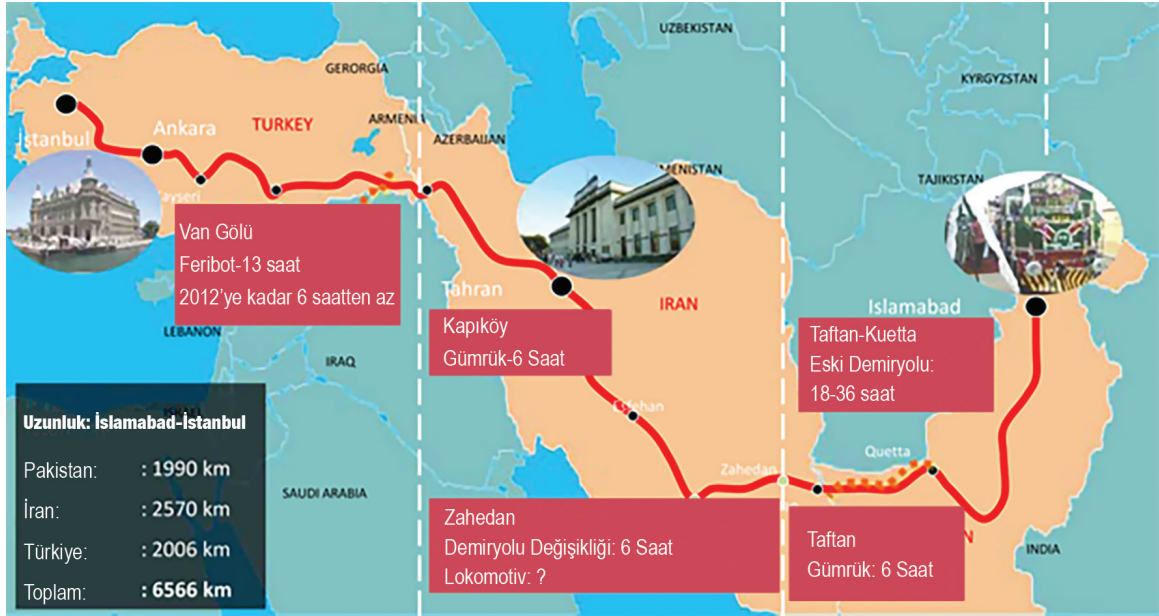
Harita 1: İslamabad-Tahran-İstanbul Demiryolu Hattı

projenin yürütülmesindeki teknik problemler, üç ülke arasında entegrasyon için gerekli olan sert altyapının geliştirilmesindeki esas zorluklar arasındadır.